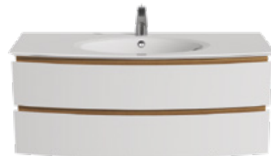
2 TIROIRS L 125 / H 50,5 / P 50,5