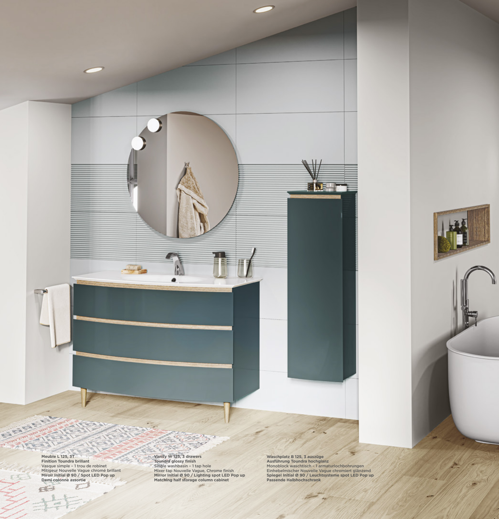
Meuble L 125, 3T Finition Toundra brillant Vasque simple - 1 trou de robinet Mitigeur Nouvelle Vague chromé brillant Miroir Initial Ø 90 / Spot LED Pop up Demi colonne assortie