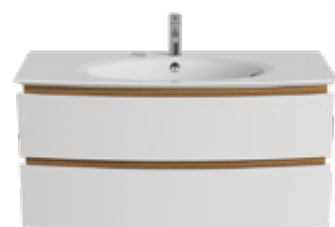
2 TIROIRS L 105 / H 50,5 / P 50,5