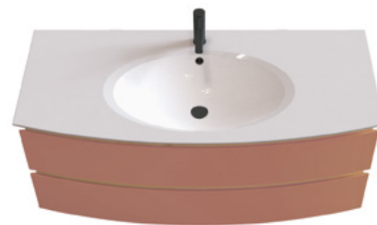
SIMPLE VASQUE – 1 trou de robinet Single washbasin – 1 tap hole Monoblock – 1 armaturlochbohrung

Disponible en L 85, 105 et 125, en 2 ou 3 tiroirs Available in W 85, 105 and 125 – with 2 or 3 drawers Erhältlich in B 85, 105 und 125 – mit 2 oder 3 auszügen