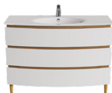
3 TIROIRS L 125 / H 75 / P 50,5