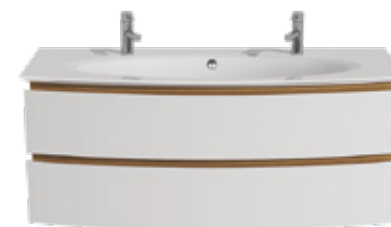
2 TIROIRS L 125 / H 50,5 / P 50,5