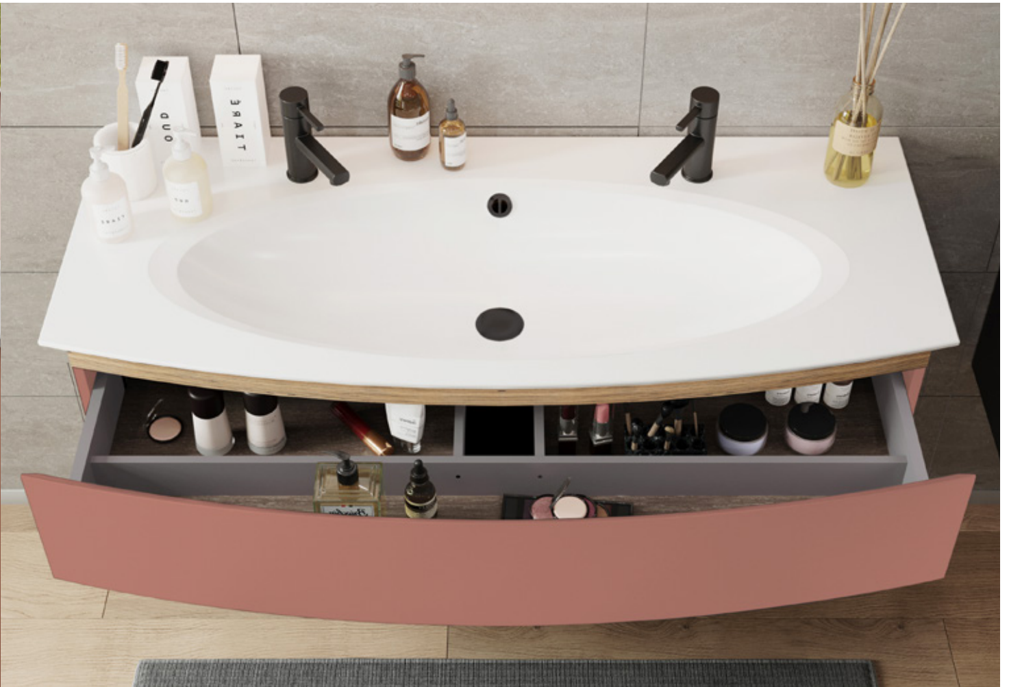
Meuble L 125, 2T – Finition Terracotta mat Simple vasque – 2 trous de robinet