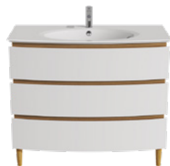
3 TIROIRS L 105 / H 75 / P 50,5