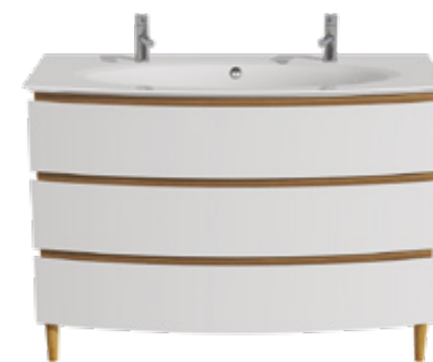
3 TIROIRS L 125 / H 75 / P 50,5