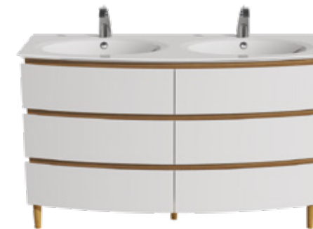
6 TIROIRS L 145 / H 75 / P 50,5