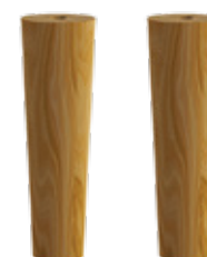
LOT DE 2 PIEDS SET OF 2 LEGS PAAR MÖBELFÜSSE FRÈNE MASSIF VERNIS TEINTÉ Ø 4,5 X H 15