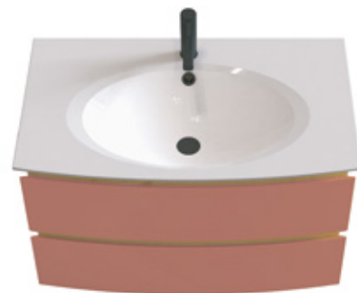
SIMPLE VASQUE – 1 trou de robinet Single washbasin – 1 tap hole Monoblock – 1 armaturlochbohrung

Disponible en L 85, 105 et 125, en 2 ou 3 tiroirs Available in W 85, 105 and 125 – with 2 or 3 drawers Erhältlich in B 85, 105 und 125 – mit 2 oder 3 auszügen