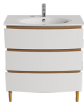
3 TIROIRS L 85 / H 75 / P 50,5