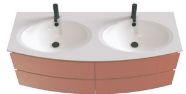
DOUBLE VASQUE – 2 trous de robinet Single washbasin – 2 tap holes Doppel-waschtisch – 2 armaturlochbohrungen

Disponible en L 125, en 2 ou 3 tiroirs Available in W 125 – with 2 or 3 drawers Erhältlich in B 125 – mit 2 oder 3 auszügen