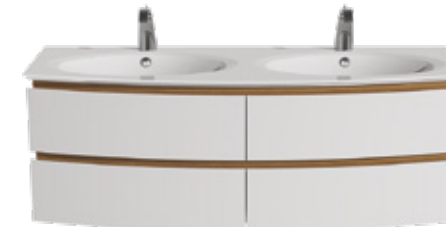
4 TIROIRS L 145 / H 50,5 / P 50,5