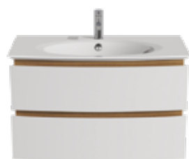
2 TIROIRS L 85 / H 50,5 / P 50,5