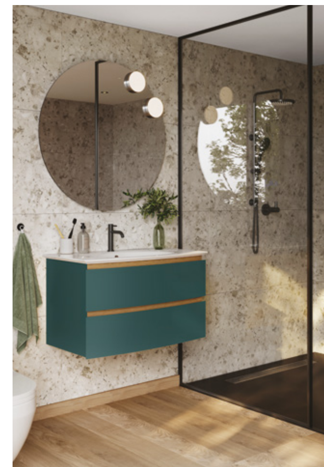
Meuble L 85, 2T Finition Canard mat Vasque simple - 1 trou de robinet Mitigeur Cadix Noir mat Miroir Initial Ø 70 Spot LED Pop up

Das Möbelstück Bel Ami ist bekannt für die Qualität seiner formaldehydfreien Lacke mit 5 Jahren Garantie, seine 30 glänzenden, matten und metallischen Farben und ist der charmante Trumpf Ihres Badezimmers..