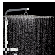
Pomme haute 300x300 système anti-calcaire