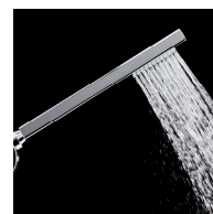
Douchette laiton chromé 1 jet système anti-calcaire