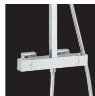
Thermostatique cartouche Vernet