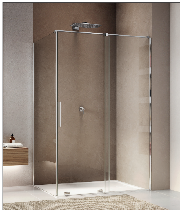
↑ AMALIA Porte coulissante 2 volets D35S2 + Paroi fixe à 90° D35F1 (Poli-brillant)