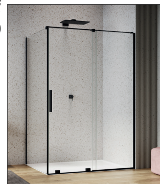
↑ AMALIA Porte coulissante 2 volets D35S2 + Paroi fixe à 90° D35F1 (Noir mat)