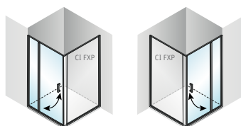
CI PIF + CI FXP