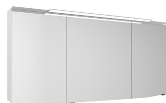
CS SPS 60 C