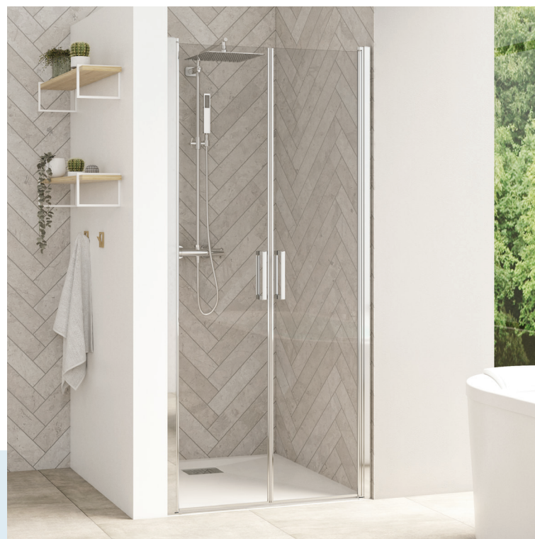
Smart Design 2P sans seuil - profilé chromé